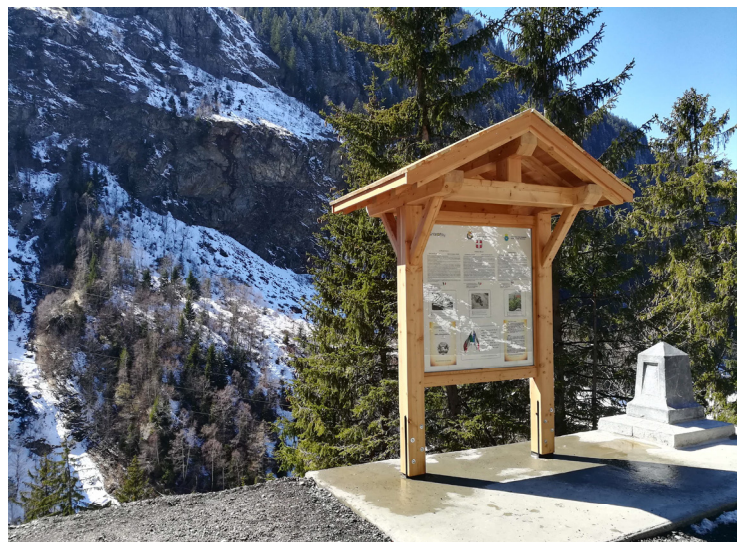
A droite du nouvel abri, la stèle érigée il y a cent ans face au Mont Pourri