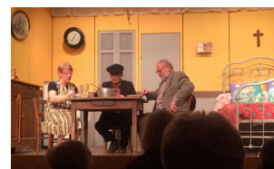
visite du Cadran Ste Foy en Brionnais

C'est aussi la découverte du marché au Cadran ou de pièces de théâtre à Sainte Foy en Brionnais