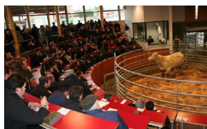
Pièce de théâtre de Ste Foy en Brionnais

C'est aussi la découverte du marché au Cadran ou de pièces de théâtre à Sainte Foy en Brionnais