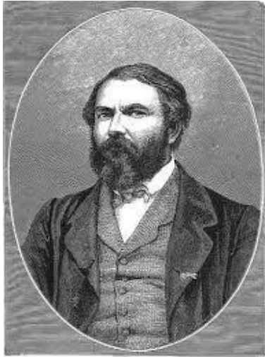
Pierre GRATIOLET 1815 - 1865