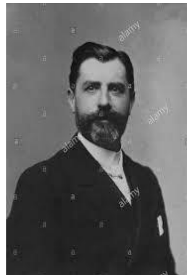
Jean Samuel POZZI 1846 - 1918