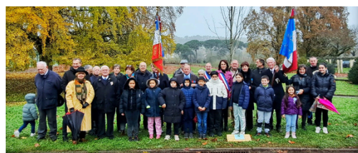
Célébration du 60ème anniversaire de l'ordre du Mérite