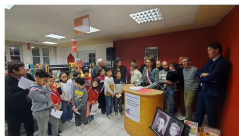
Inauguration de la Bibliothèque Suzanne Chaumet