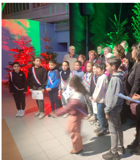
Voeux de la Municipalité

Les jeunes conseillers municipaux "junior" s'impliquent dans la vie locale en participant activement à différents évènements organisés par la municipalité.