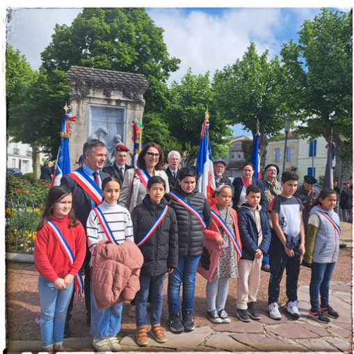
Cérémonie commémorative du 8 mai